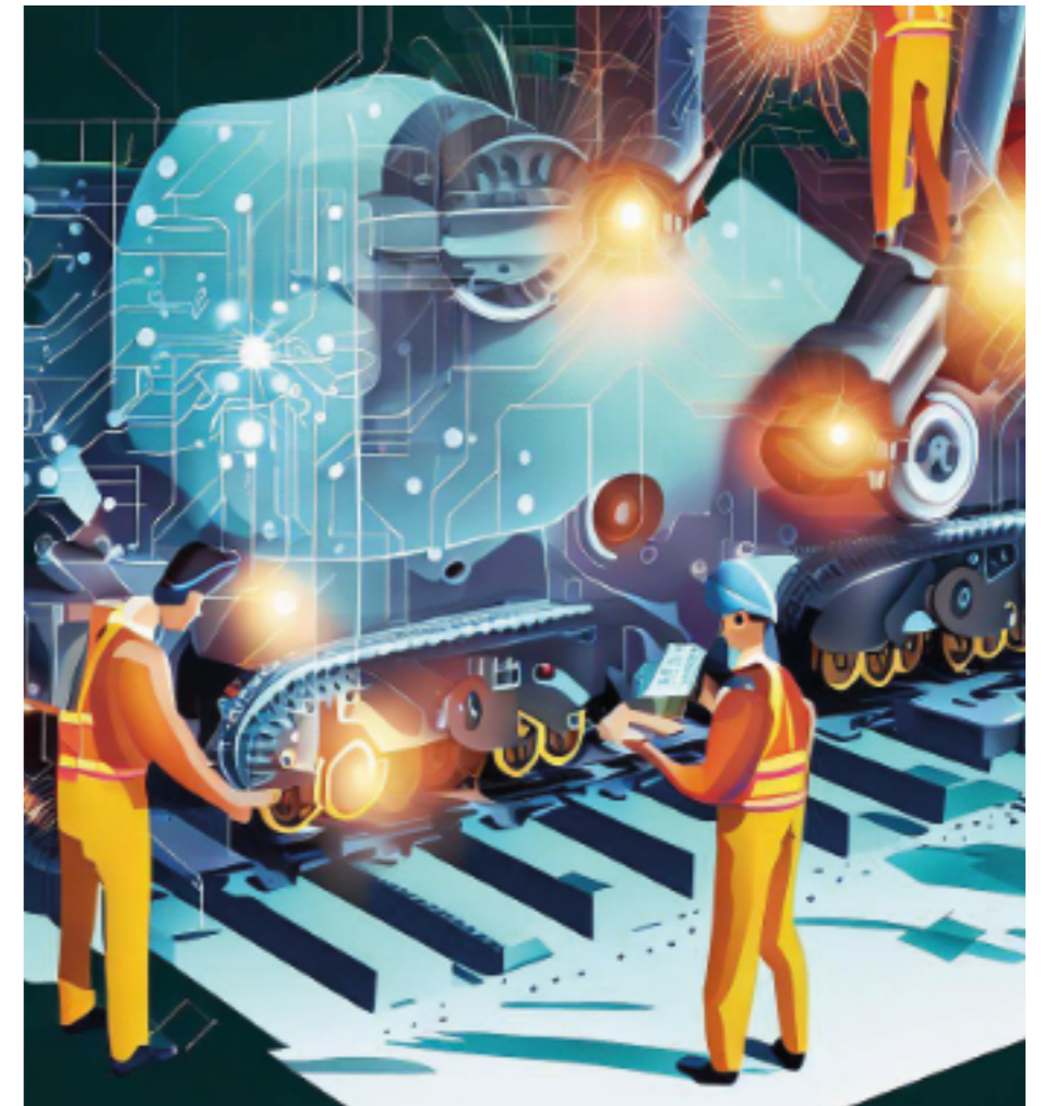
Illustration Bing Image Creator

La tendance est de cantonner le travail humain à des tâches de surveillance ou de manutention. Beaucoup d'opérations de maintenance recourent à des programmes informatiques. Or les techniciens qui les pilotaient sont le plus souvent remplacés par des opérateurs pour