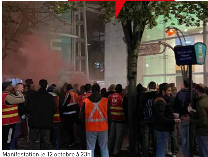
Manifestation le 12 octobre à 23h devant la Maison de la RATP.